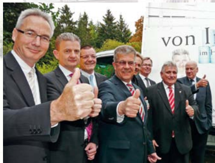
Optimismus pur: Hochkarätige Gäste waren beim Kampagnenstart dabei.