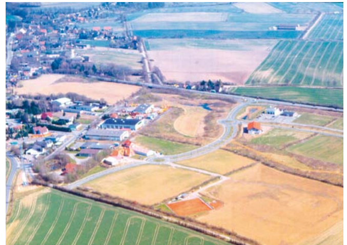
Gewerbegebiet Breitenfelde – optimale Verkehrsanbindung