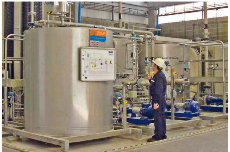
Hightech-Filtersysteme von DMS aus Ratzeburg sind international gefragt.

Jetzt hat DMS ein neues eigenes Filtersystem mit dem Namen BlueFilter entwickelt. „Damit werden wir in Zukunft unsere Schlüsselprojekte betreuen“, erläutert Diplom-Ingenieur Reinhardt. „Es ist eine Weiterentwicklung des bisher genutzten CrossRotation-Filters – bei dem ein Rotor zwischen zwei Membranen für eine effektivere Filtration sorgt – mit gänzlich neuen Konstruktionsmerkmalen.“ Das EU-Patent sei für BlueFilter beantragt, Patente für Nordamerika würden folgen. Reinhardt: „Den ersten BlueFilter