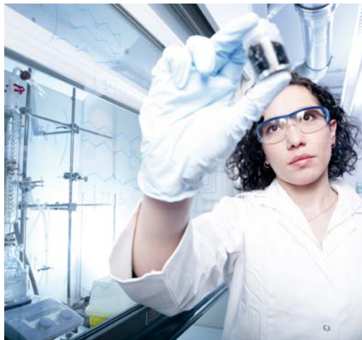
Spitzenforschung am GKSS-Forschungszentrum