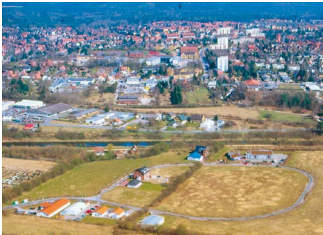
Gewerbegebiet Alt-Mölln – ideal für Arbeiten und Wohnen

■ Nähere Auskünfte gibt Dieter Hamann unter 04541 8604-0. Er stellt gern Kontakte zu Bauunternehmen her, die solche Kombinationsgebäude anbieten.